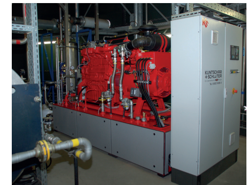
BHKW mit Steuerschrank aufgestellt